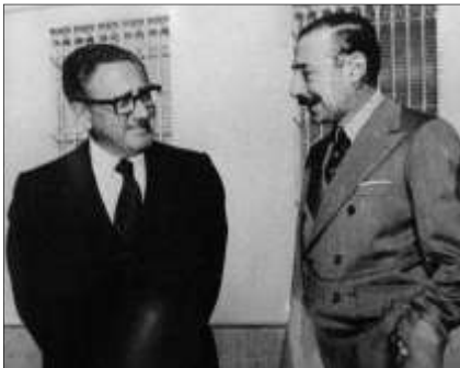
Kissinger con Videla y Pinochet

1973 → un golpe de estado financiado y organizado por EE.UU derroca al gobierno de Salvador Allende en Chile. La dictadura del general Pinochet recibirá el apoyo americano.