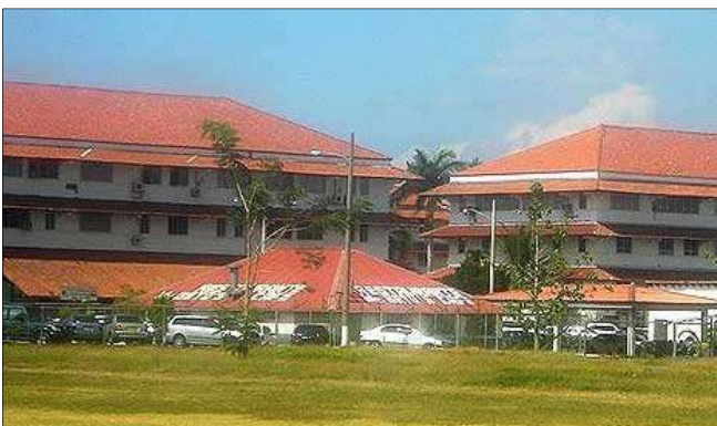
Escuela de las Américas, Panamá