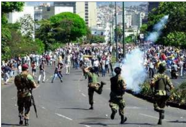
11 de abril de 2002: golpe fallido contra Chávez