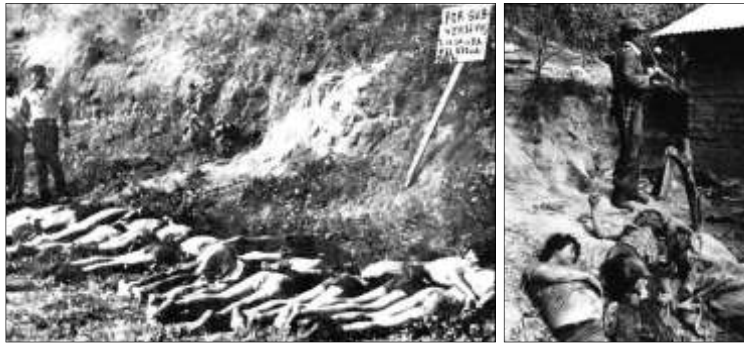
Víctimas de los escuadrones de la muerte

1980 → EE.UU suministra asistencia masiva a los militares de El Salvador, que luchan contra la guerrilla del FMLN. Los escuadrones de la muerte proliferan: 35.000 civiles mueren en 3 años.