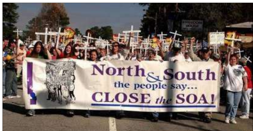
Manifestación convocada por la SOAW ( School of the Americas Watch ) para pedir el cierre de la escuela