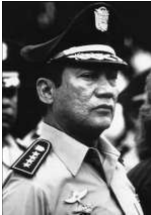
Noriega con George Bush

1989 → EE.UU invade Panamá para detener al dictador Manuel Noriega, su ex protegido.