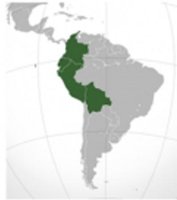
CAN Comunidad andina