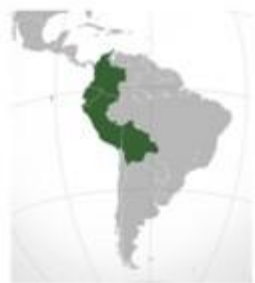
CAN Comunidad andina